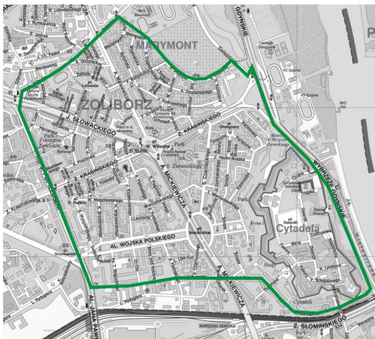
Mapa strefy ochrony konserwatorskiej Żoliborza Historycznego

Pozytywna weryfikacja projektów zlokalizowanych w strefie ochrony konserwatorskiej uzależniona będzie od zgody Konserwatora Zabytków na realizację tych projektów.